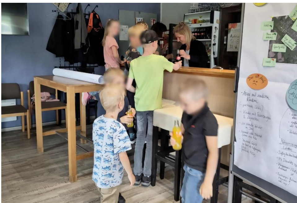
Abb. 2: Kindergruppe, Getränke und Snacks im Sportheim

Im Anschluss an die Abfrage wurden die Kinder für ihre gute Mitarbeit mit einem Imbiss belohnt, den sie gern annahmen.